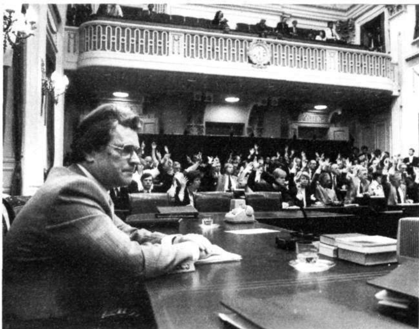
Staatssecretaris De Graaf volgt van achter de regeringstafel de stemmingen over de wetsvoorstellen met betrekking tot de sociale zekerheid

De Voorzitter: Ik stel voor, de door de regering voorgestelde wijzigingen (stuk nr. 97) aan te brengen.