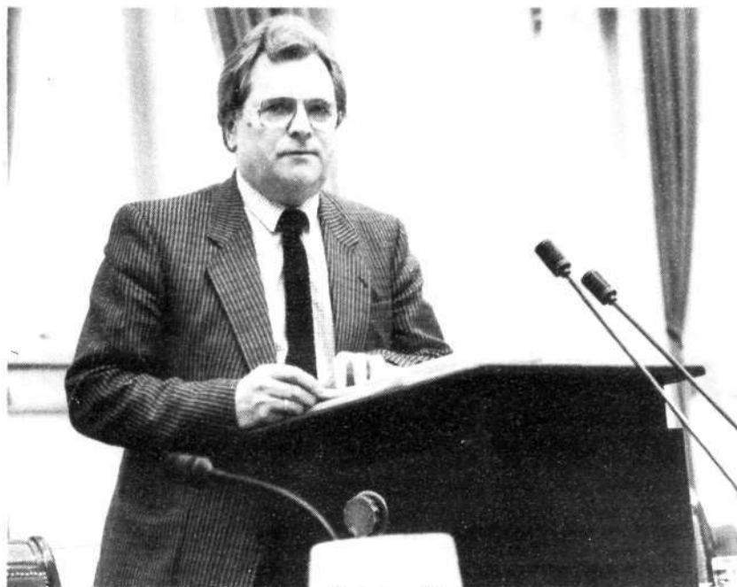
Staatssecretaris De Graaf van Sociale Zaken en Werkgelegenheid aan het woord

Tevens zijn enkele nadrukkelijk uitgesproken wensen meegenomen. Over de inhoud van deze nota's van wijziging komen ik en mevrouw Kappeyne van de Copello nog te spreken.