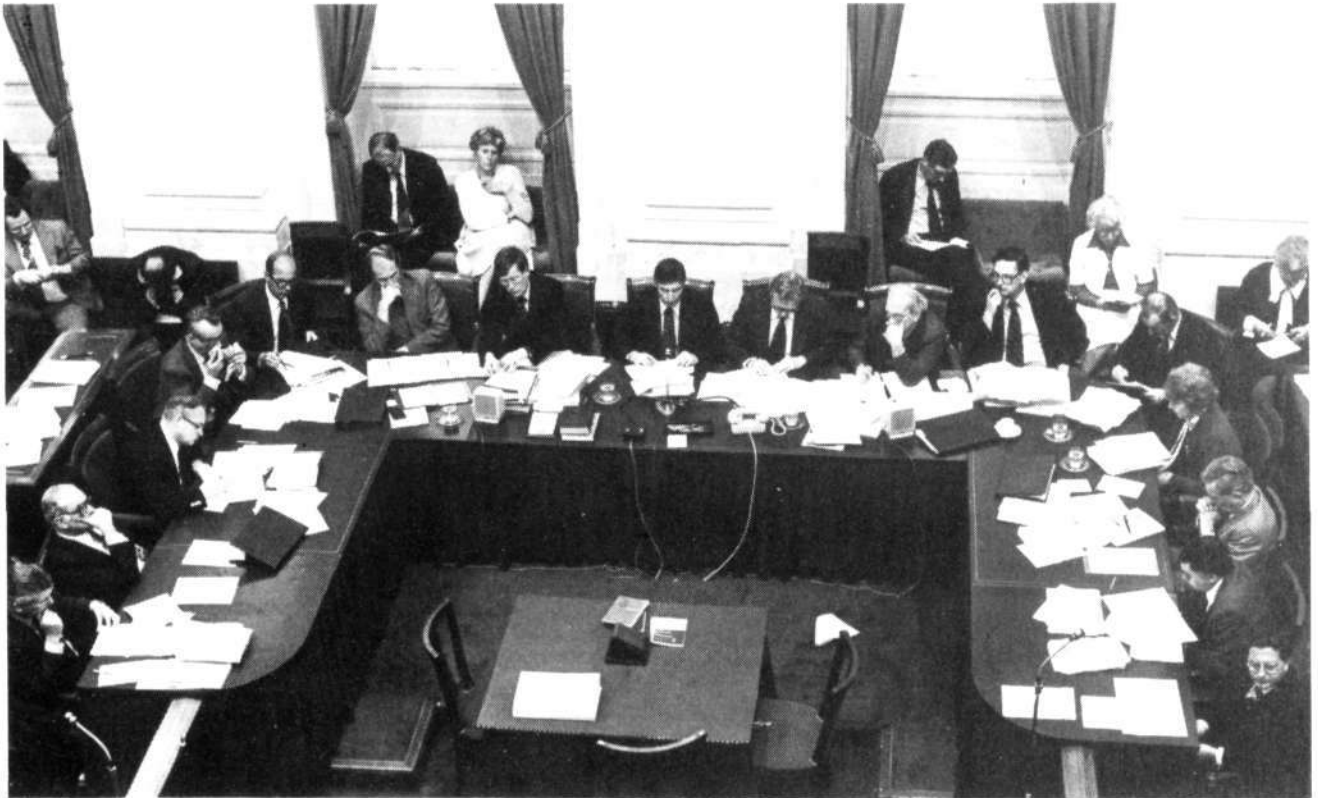
Het Kabinet achter de regeringstafel