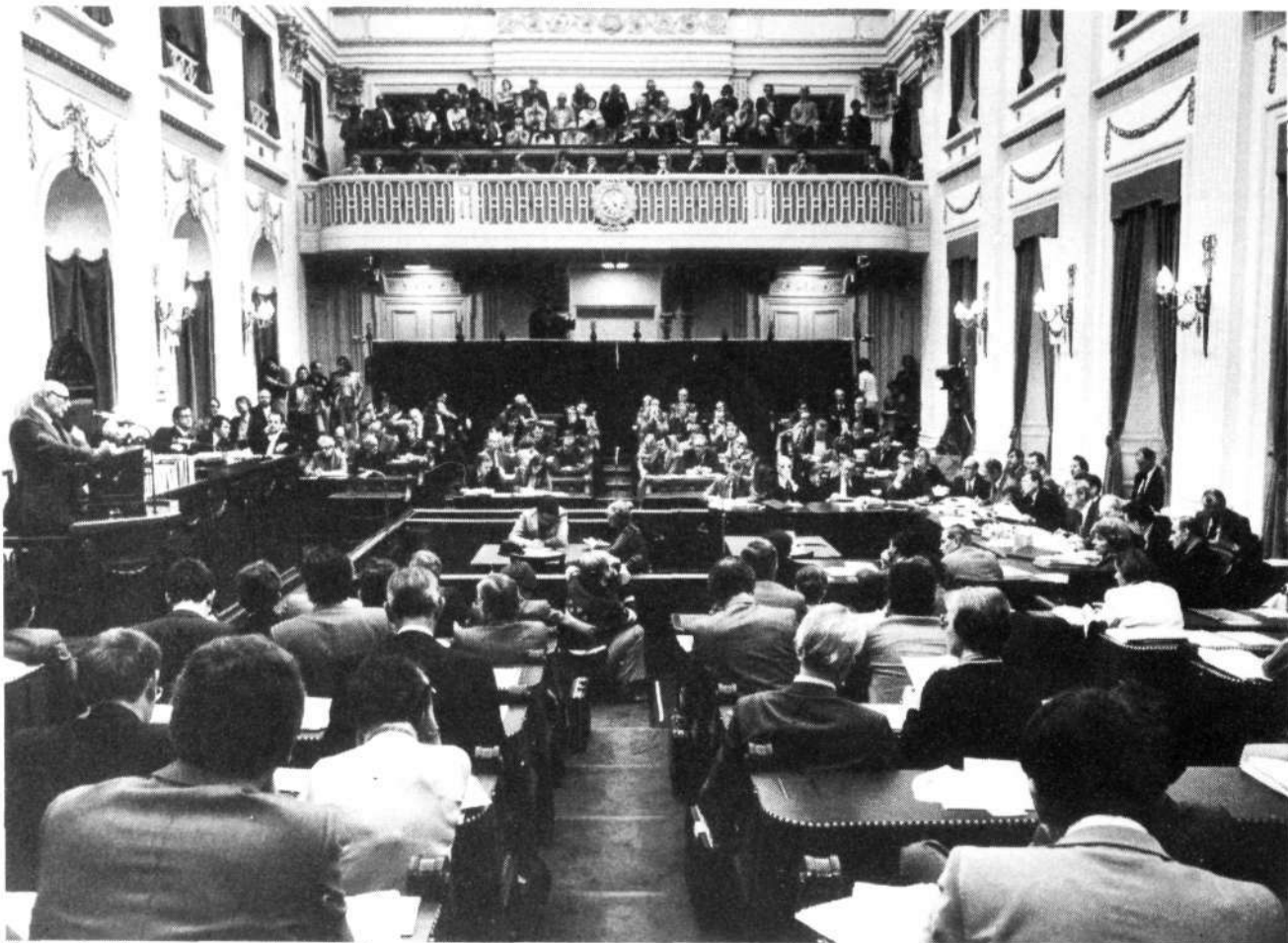
De heer Den Uyl, de eerste spreker bij de algemene beschouwingen

Welnu, wij menen dat het kabinet de aard van de werkgelegenheidsproblematiek onvoldoende onderkent, de doeleinden niet duidelijk stelt en te veel vertrouwt op klassieke instrumenten.