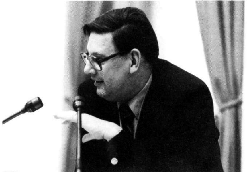
Minister Van Aardenne (Economische Zaken)

Mijnheer de Voorzitter! Een aantal fracties hebben al in de schriftelijke voorbereiding bezwaar gemaakt tegen het voornemen om de opdracht aan de wetgever tot het stellen van regels met betrekking tot een zuinig gebruik van grondstoffen uit artikel 5 te verwijderen. Wij hebben dat gedaan, omdat naar onze mening eigenlijk onvol-