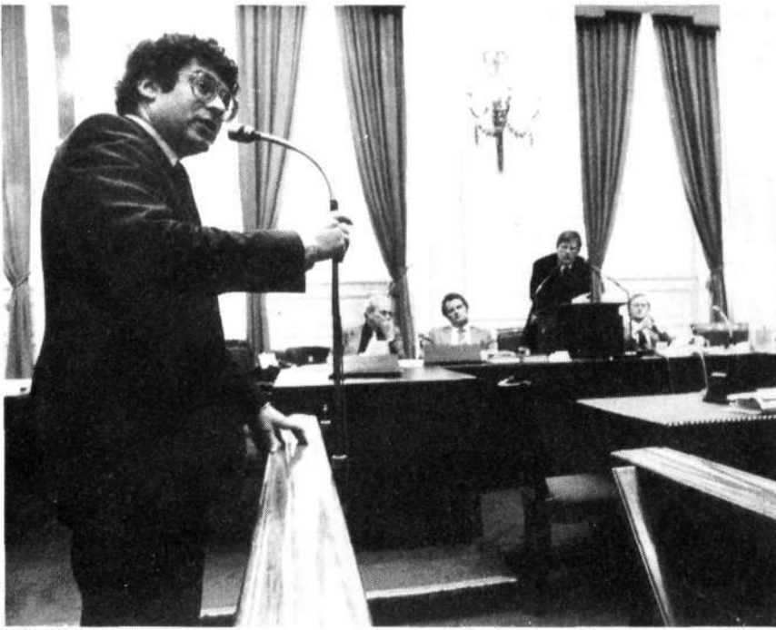
De heer Van Thijn (PvdA) onderbreekt het betoeg van Minister Wiegel

Het standpunt van de meerderheid ken ik. Ik heb ook gezegd wat mijn persoonlijk standpunt is, maar dat maak ik hier niet publiek. Dat is een zaak van mijn overleg als werkgever met de ambtenarencentrales. Ik kan het hier ook niet publiek maken. Als ik het wél deed, zou ik de discussie met mijn ambtgenoten belasten, want de zaak komt natuurlijk met hen in discussie: eerst in de raad voor de rijksdienst en dan in de ministerraad. Het standpunt dat de ministerraad dan inneemt, zal ik met de centrales bediscussiëren. Dat heb ik hun toegezegd. Oorspronkelijk zouden wij in juli niet bijeenkomen, maar wij hebben besloten dat toch te doen om in ieder geval te proberen daar zo snel mogelijk klaarheid over te hebben, want de zaak moet natuurlijk niet in 1979 onder de tafel verdwijnen. Die afspraak heb ik met de bonden gemaakt.