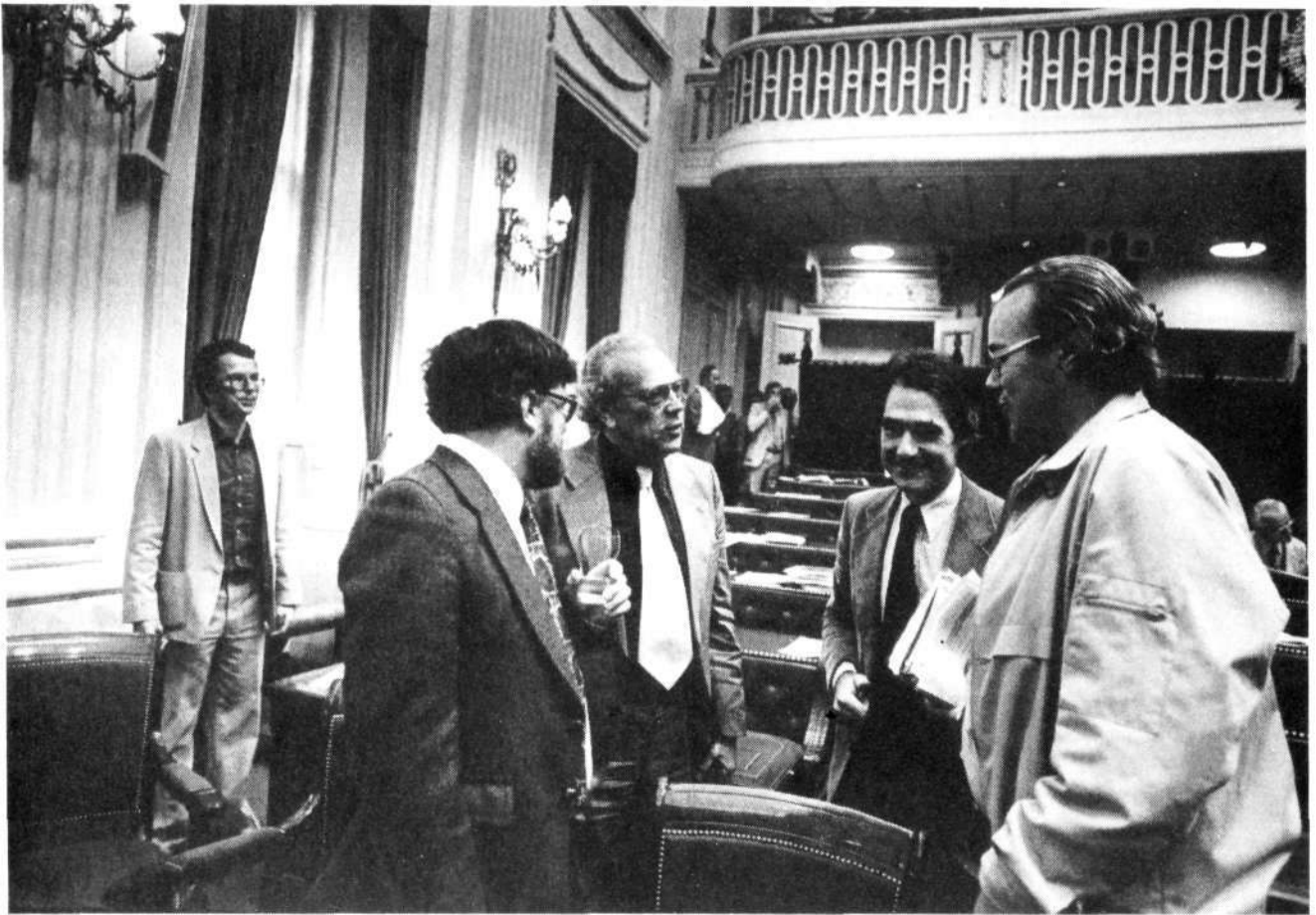
Informeel gesprek tussen v.l.n.r. de heer Wöltgens (PvdA), Minister Albeda en de heren De Korte (VVD) en Castricum (PvdA)

koming, en bij gevolg registratie van de collectieve arbeidsovereenkomsten.